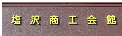
茶色い外壁に黄色文字が映えます