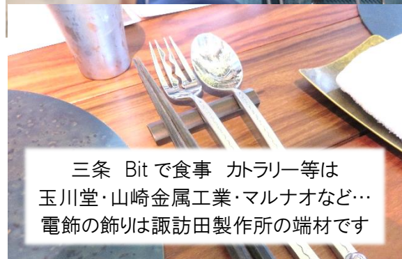
三条 Bit で食事 カトラリー等は玉川堂・山崎金属工業・マルナオなど…電飾の飾りは諏訪田製作所の端材です