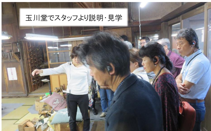
玉川堂でスタッフより説明・見学