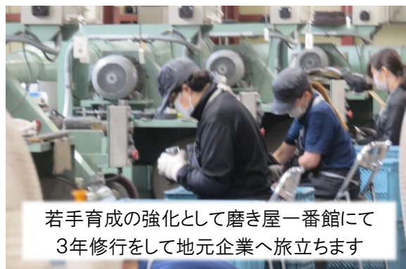
若手育成の強化として磨き屋一番館にて3年修行をして地元企業へ旅立ちます