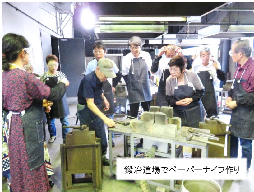
鍛冶道場でペーパーナイフ作り

毎年一回研修旅行を実施している観光部ですが、今年は三条・燕方面に研修に行きました。ペーパーナイフ作り体験・磨き屋一番館・玉川堂・諏訪田製作所の見学と、盛りだくさんの研修でした！