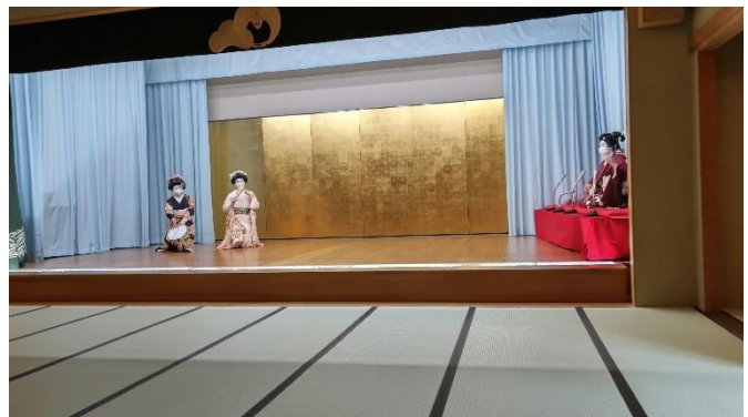
芸妓さんの華やかな舞いを堪能しました