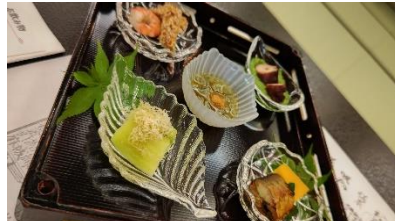
見た目も美しい膳菜