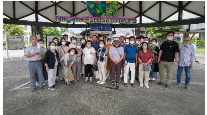
新潟ふるさと村での記念写真